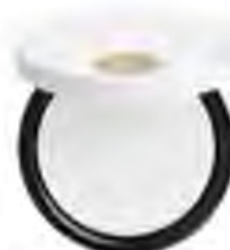
Matující pudr Radiant Matte Powder, HERMÈS, 2 280 Kč