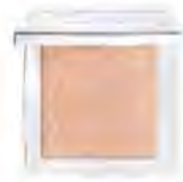
Matující pudr Dior Backstage Face and Body Powder-No-Powder, DIOR, 1 352 Kč