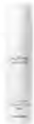
Colour Corrector Serum, ALPINE WHITE, 590 Kč