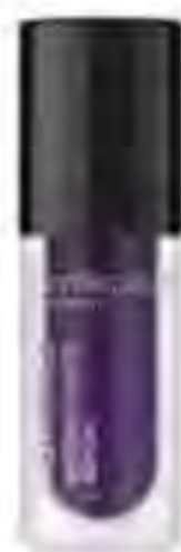
Instasmile Instant White Serum, SMILEPEN, 555 Kč

Star produkt: Okysličující maska Oxygenation Mask, SHANE COOPER UK, 4 229 Kč