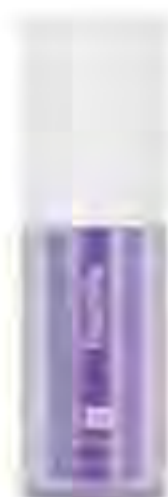
V34 Colour Corrector, HISMILE, 549 Kč